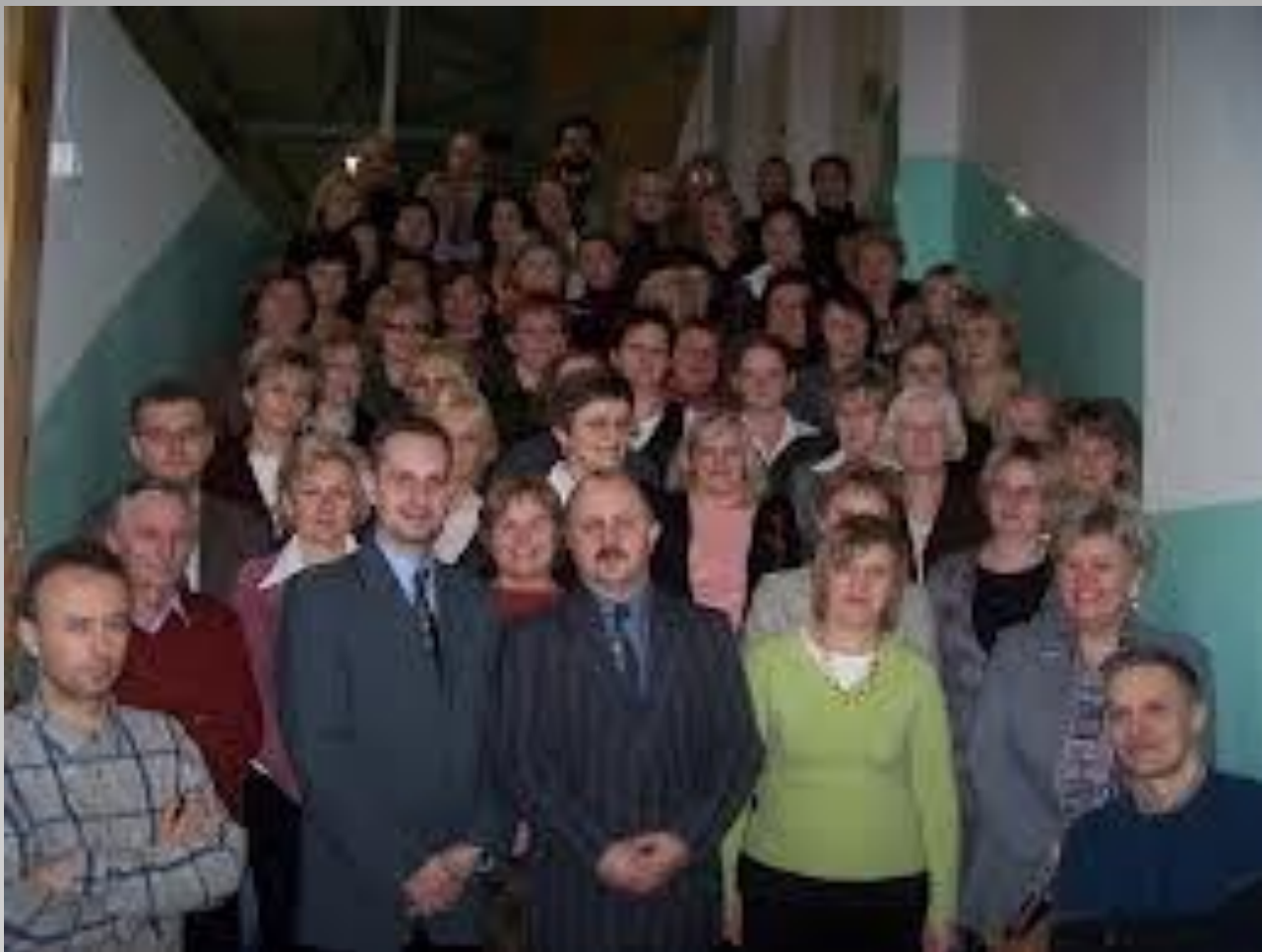
Duża Rada Pedagogiczna